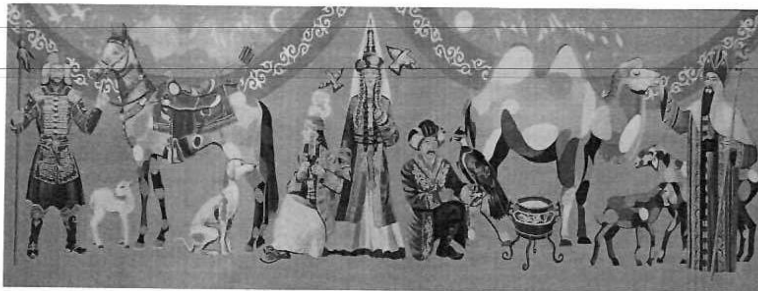
Композиция бойынша тапсырма үлгісі