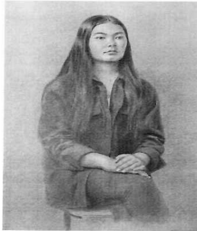
Сурет бойынша тапсырма үлгісі